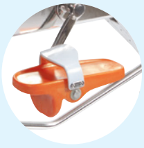
Confort pieds nus

Le Système Spinning Pro 2 du WR5 permet de régler la résistance mécanique au pédalage. Ajustez la difficulté d'exercice et personnalisez l'effort depuis la position assise en tournant la molette . Simple et efficace, l'effort est accentué. Un frein tampon vient agir sur une roue en acier inoxydable 316L de qualité marine pour une efficacité inégalée.