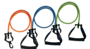
ÉLASTIQUES 3 RÉSISTANCES AU CHOIX