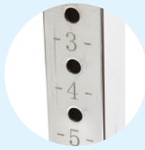
Réglages gradués précis