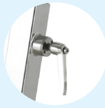
Réglages rapides Click & Turn