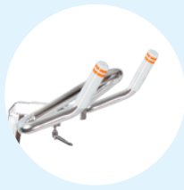
Guidon Sport 45°