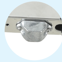
Anode sacrificielle pour usage marin